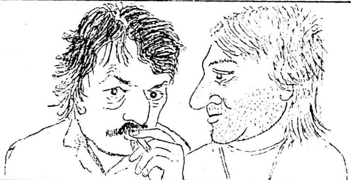
Бого. — А... что е-скажет З-Змий? Бого. — Папа, я ёбрут...

ПРОЦКВИР, ИЦКИРИН Москва — Минск, 1988 г.